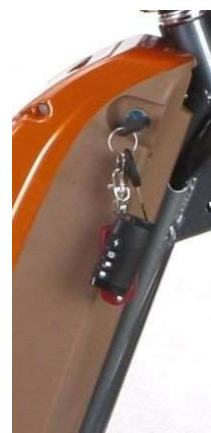
SISTEMA DE ALARME