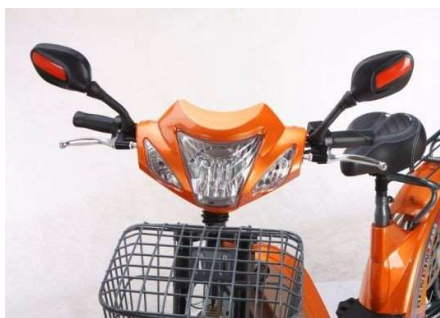
FAROL AUXILIAR FRONTAL